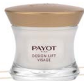
50 ml Tiegel

Die Ergebnisse: Die Haut ist intensiv regeneriert, optimal mit Nährstoffen versorgt und wirkt wieder geschmeidig und gestrafft. Die Gesichtszüge sind geglättet, die Konturen sind sichtbar straffer.