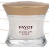
50 ml Tiegel