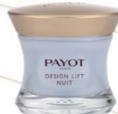
50 ml Tiegel