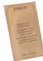
Packungsinhalt: 10 Beutel mit je 2 Kompressen (1,5 ml)